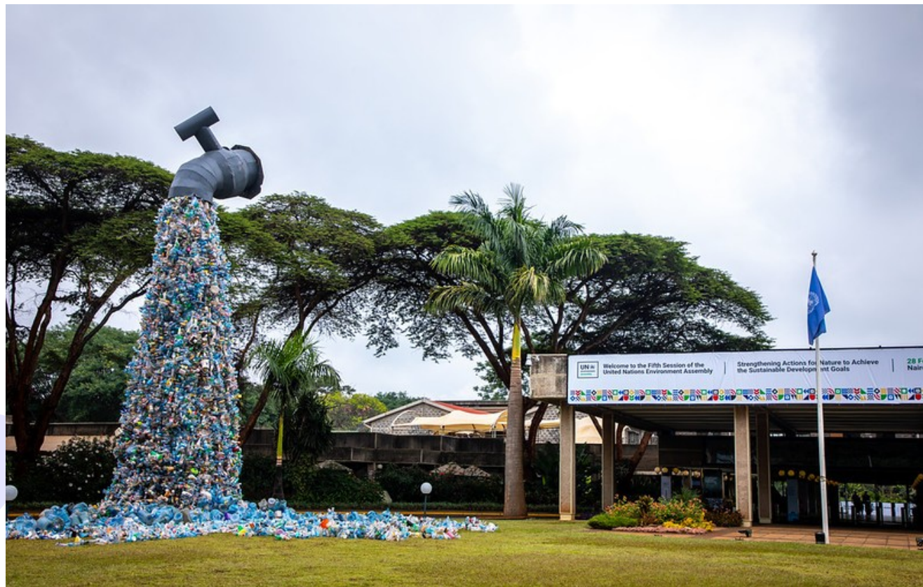
Skulptur des Kanadischen Künstlers Benjamin von Wong, hergestellt mit Plastik aus den Kibera Slums, Nairobi, vor der 5. Session der United Nations Environment Assembly (UNEA-5), 2022